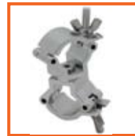
RD32-35mm, 30mm SWL 75kg