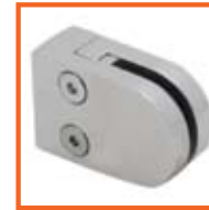
6-10mm plaat/plate TTADHAH90 10-16mm plaat/plate TTADHAH92