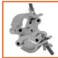
RD48-51mm, 50mm SWL 500kg