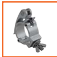
RD48-51mm, 30mm SWL 100kg, M10 slank / thin quicklock