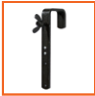
50mm, SWL 50kg