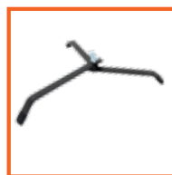
Staal 25 x 8mm M10 bout