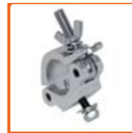
RD48-51mm, 30mm SWL 250kg, M10