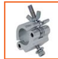
RD48-51mm, 50mm SWL 500kg, M10