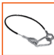
lengte / length 45 cm 60 cm.