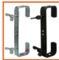
225 mm, SWL 50kg