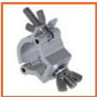
RD32-35mm, 30 mm SWL 75kg, M10