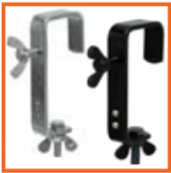
50mm, SWL 50kg