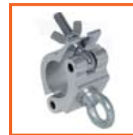
RD48-51mm, 50mm SWL 170kg, met hijs oog/ with lifting eye