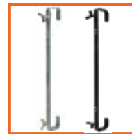
600mm, SWL 50kg