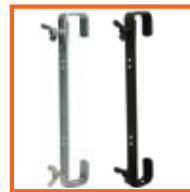
400 mm, SWL 50kg