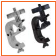
51 mm alu. SWL 250kg, M10