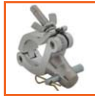
RD48-51mm, SWL 125kg, M10