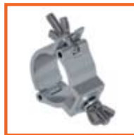
RD48-51mm, 30mm SWL 100kg, M10 slank/thin